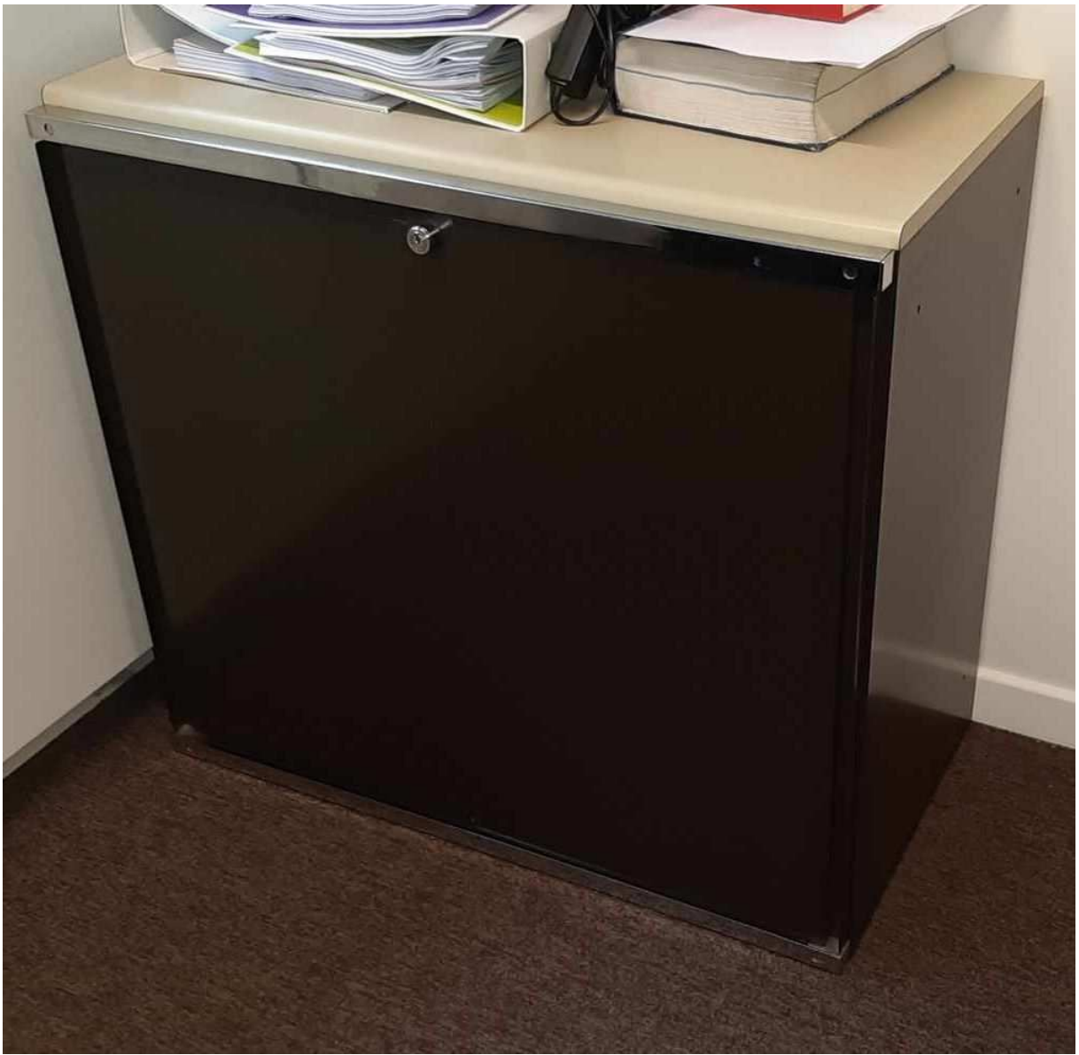
Il y en a une grande et une petite, qui ferment à clé.