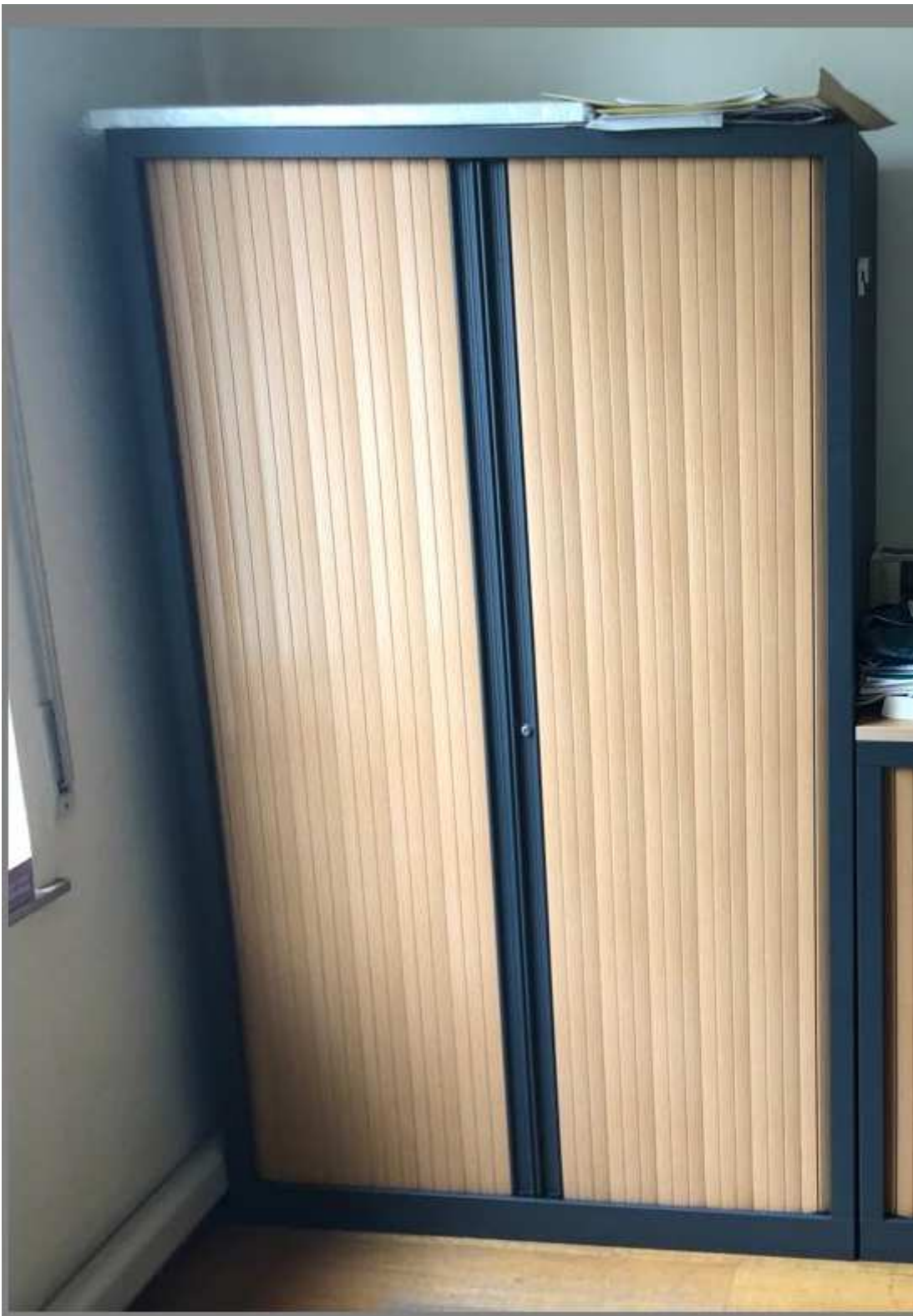
Il y en a une grande, qui ferme à clé.