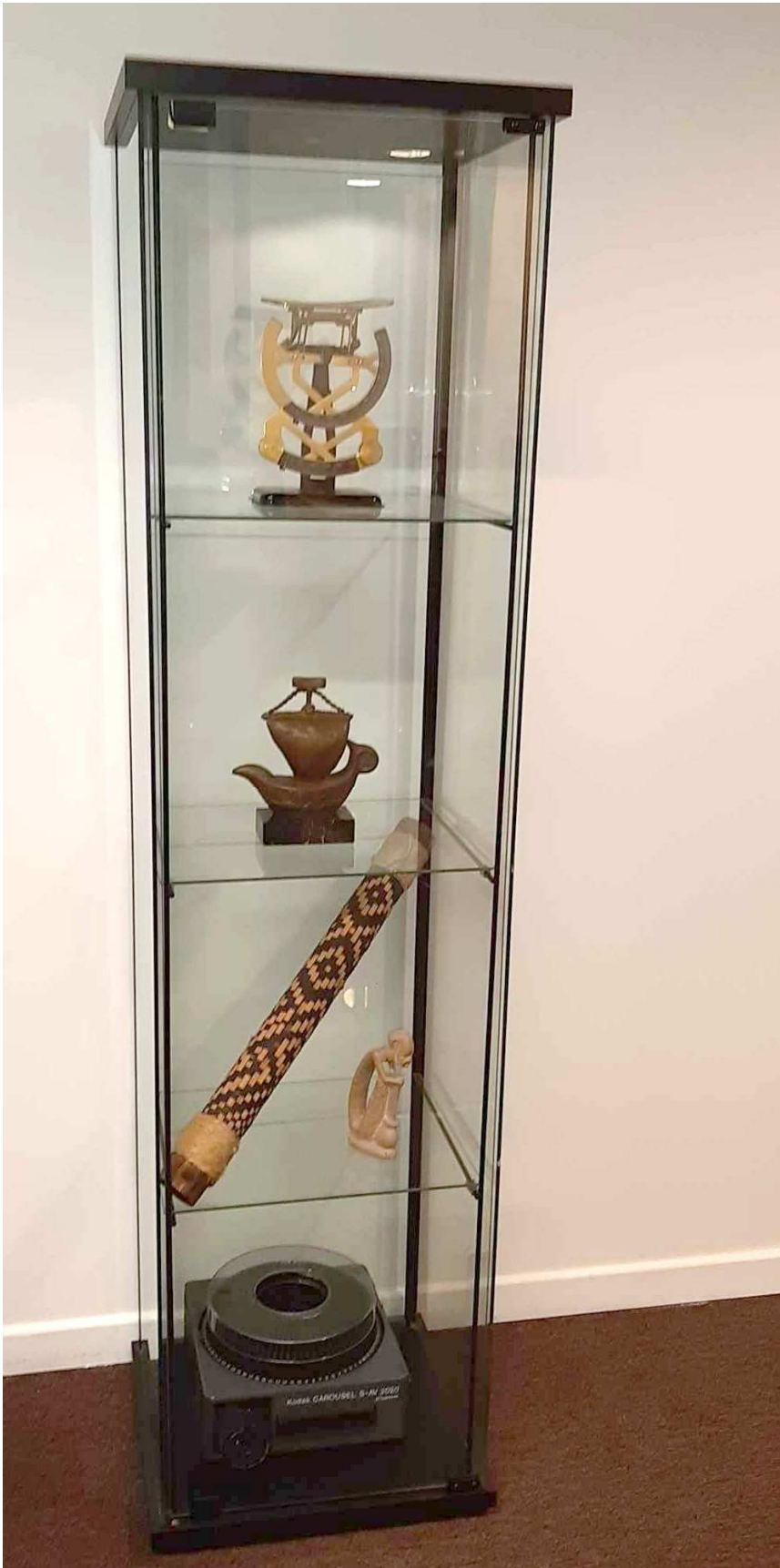
Il y en a trois