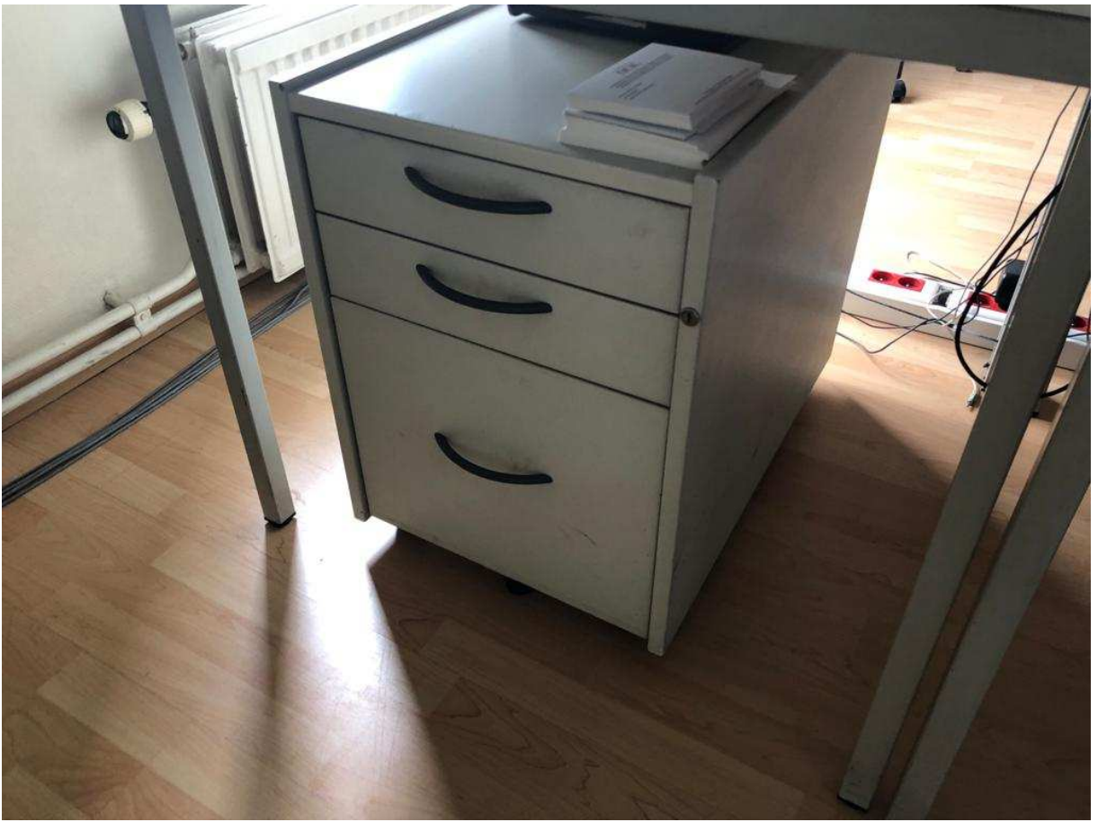
Il y en a 4