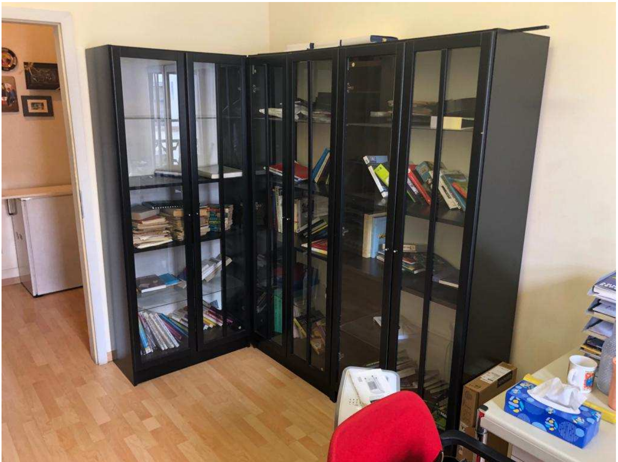
Il y a au total 4 armoires, aux portes vitrées